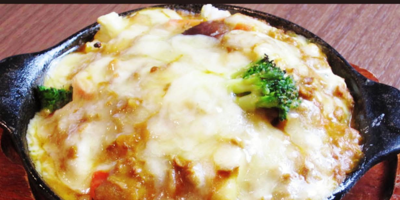
野菜たっぷり焼きチーズカレー 680 8種類の野菜を使用したオープン焼きカレー。