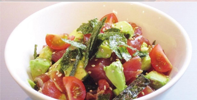
マグロとアボカドのどんぶり 780 (浅漬け付き) マグロとアボカドの相性が抜群!